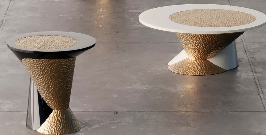
1 Luminária Mandú, de Everton Souza, do Estúdio Dendê, R$ 4.400 2 Coluna Pérolas, design Nicholas Oher para a Samba Design, R$ 12 mil 3 Bufê Paisagem Incerta, design Yohannah de Oliveira para a Verniz, R$ 75 mil 4 Biombo da coleção Fonderia Fendi, design Conie Vallese para a Fendi (a marca não divulga o preço) 5 Poltrona King, do Studiobola, a partir de R$ 49.895,06 6 Mesas de jantar, de apoio e de centro Merge, de Marina Kürten Moreira, a partir de R$ 16.360 cada