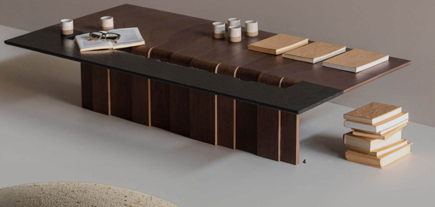
1 Tapete Tebas, design João Gabriel para a Tapetah, R$ 6.400 2 Poltrona Pilar, design Studio Roca para a Breton, R$ 14.839 3 Luminária de mesa Mon, design Ronald Sasson para a Tecline, R$ 6.875 4 Mesa Salto, design Bruno Felipe para o Dopo Studio, R$ 17.920 5 Estante Origami, da Sette7, na Herança Cultural, R$ 70 mil 6 Armário Encaixe, de Guilherme Wentz, da Wentz, a partir de R$ 32.700 o modelo com 2,10 m